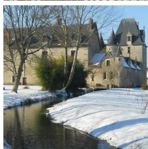
© C. Vidanova / Château de Fougères-sur-bièvre © L. Garrigue