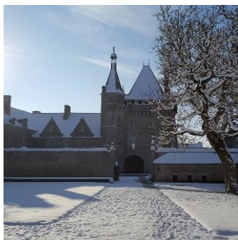
Château de Talcy