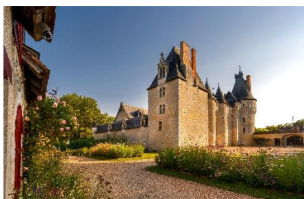
Château de Fougères-sur-Bièvre depuis les communs au coucher du soleil

Fougères se distingue des grands châteaux de la Loire par une architecture sobre et puissante, très peu remaniée au cours des siècles. Il illustre l'art de bâtir dans la région avec ses murs en moellons de calcaire de Beauce et ses parties moulurées ou sculptées en tuffeau des bords du Cher. Petits et grands y retrouvent facilement tous les attributs militaires et la disposition intérieure d'un petit château fort particulièrement bien conservé de la fin du XV e siècle.