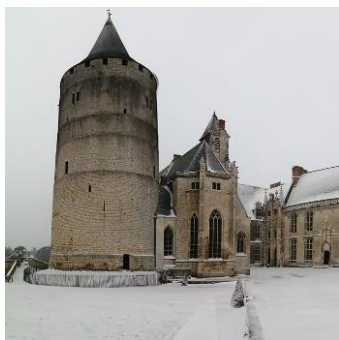
Château de Châteaudun

Tarifs : 6 € - gratuit pour les moins de 26 ans.