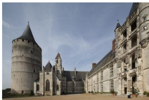
Vue côté cour

Un jardin exceptionnel d'inspiration médiévale explore les relations entre cuisine et médecine au Moyen Âge. Un jardin d'exception suspendu, accroché à mi-hauteur côté Loir, dévoile un jardin d'oisiveté et de détente réservé à l'usage du propriétaire des lieux à l'origine de sa conception. Jehan de Dunois, dit le « bâtard d'Orléans », demi-frère du comte Charles d'Orléans et fidèle compagnon d'armes de Jeanne d'Arc, fait de l'ancien château médiéval une demeure confortable et claire et le dote d'une Sainte-Chapelle. Les travaux commencent vers 1450 pour ne s'achever que vers 1530.