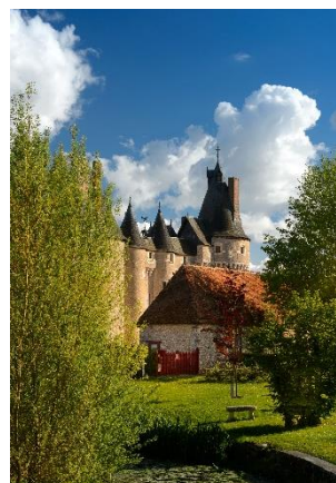
Château de Fougères-sur-Bièvre depuis le jardin

Traversé par la Bièvre, le jardin d'inspiration médiévale est composé de parterres surélevés carrés ou rectangulaires, consolidés par des « planches », dans lesquels poussent simples, herbes et légumes. Des treillages de châtaigner enjambent les petits ponts sur le bief.