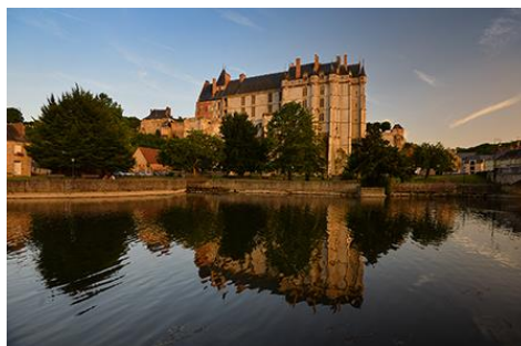
Vue côté Loir

Accroché à son promontoire rocheux, la « grosse tour » du XII e siècle, l'un des donjons les plus hauts et les mieux conservés en France, est accessible en visite commentée. L'aile Dunois du XV e siècle et l'aile Longueville du XVI e comportent deux somptueux escaliers à loggias, l'un au décor flamboyant, et l'autre d'époque Renaissance. La Sainte Chapelle gothique du XV e siècle conserve quinze statues des ateliers de la Loire et montre une peinture murale du Jugement dernier datant de 1468. Le château abrite une collection remarquable de tapisseries flamandes et françaises des XVI e et XVII e siècles, qui sont particulièrement mises à l'honneur dans un parcours de visite repensé dans l'aile Longueville. Les vastes cuisines médiévales sont particulièrement bien conservées.