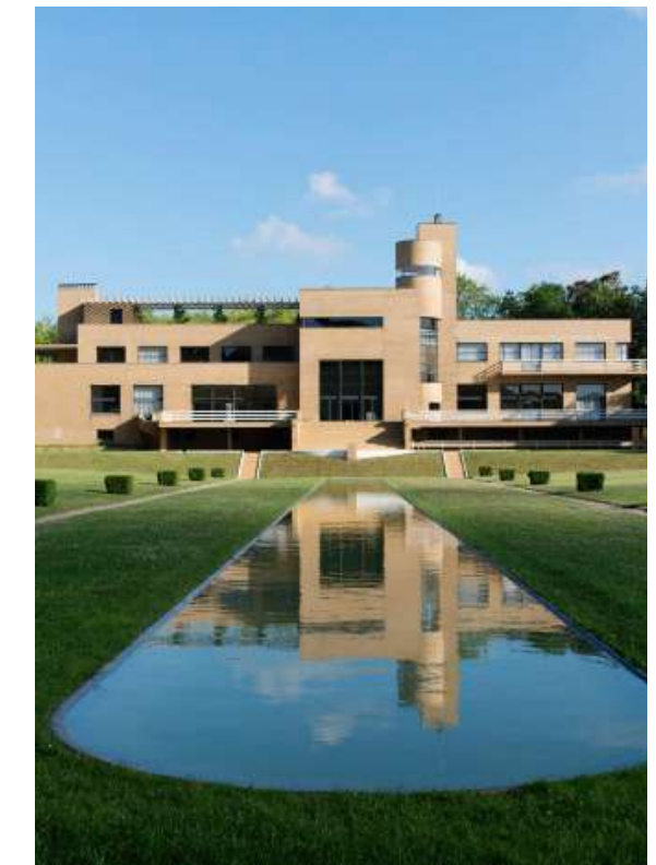
Villa Cavrois à Croix (59)