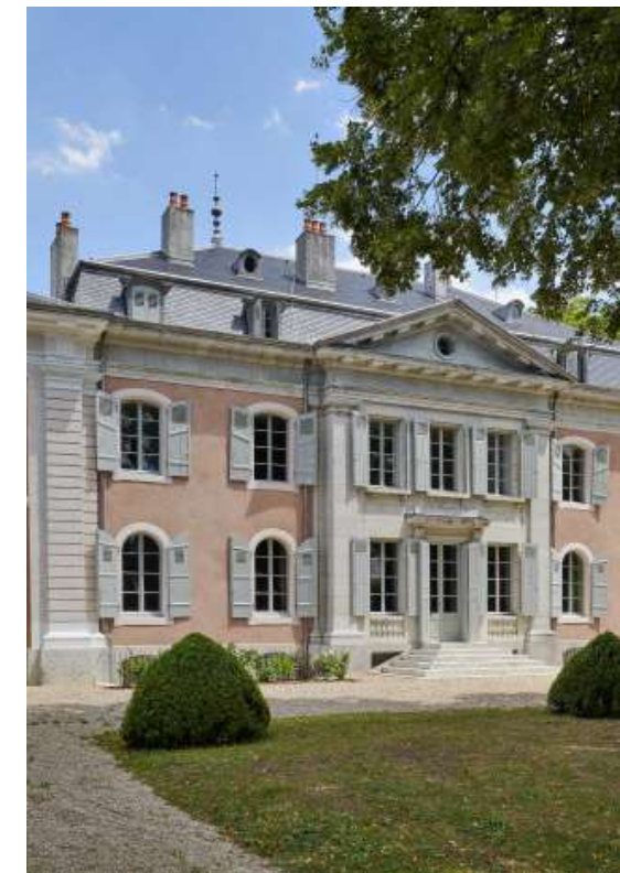
Château de Voltaire à Ferney (01)